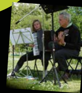
Duo Verkijk (subtiële wereldmuziek)