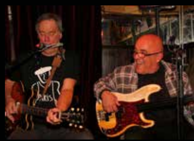
Hokum Boys (jazz, folk)